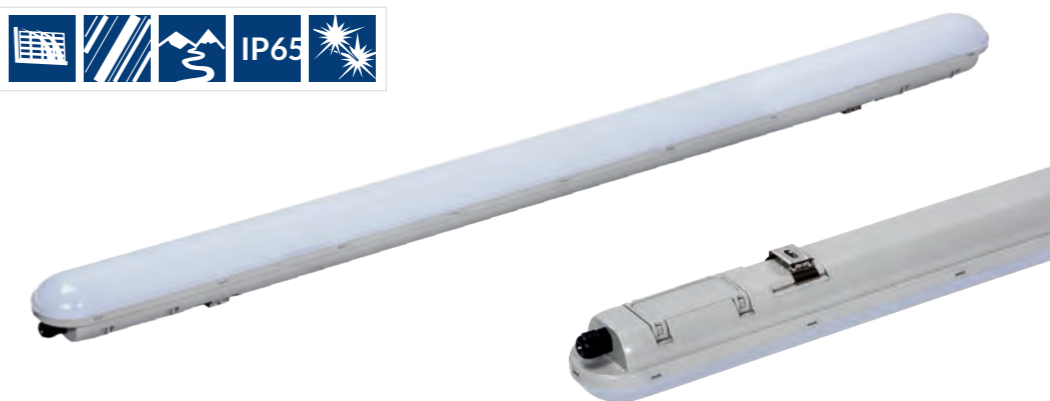
LPL0620NBASCR LPL1240NBASCR LPL1550NBASCR