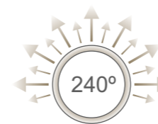
Ángulo de iluminación de 240° 240° illumination angle