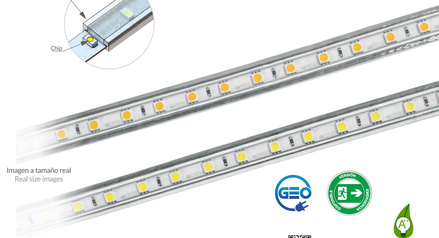
Imagen a tamaño real Real size images